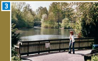
Seepanorama am Stauteich III