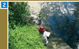
Muße am Stauteich II