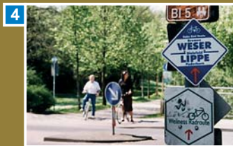
Radweg an der Lutter