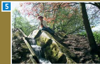
Kaskaden in die Lutter